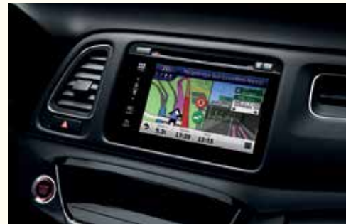
Навігаційна система Garmin*