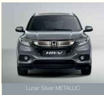
Lunar Silver METALLIC