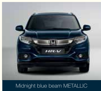
Midnight blue beam METALLIC