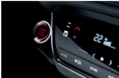
Сенсорна панель клімат-контролю