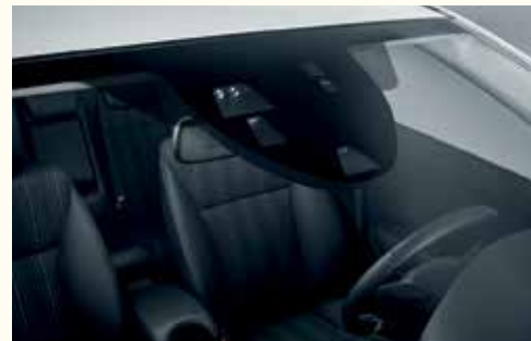
Передові системи безпеки