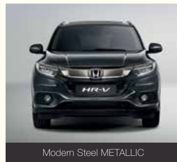
Modern Steel METALLIC