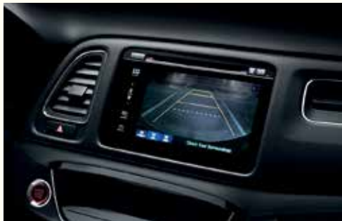
Багатопроєкційна камера заднього огляду*