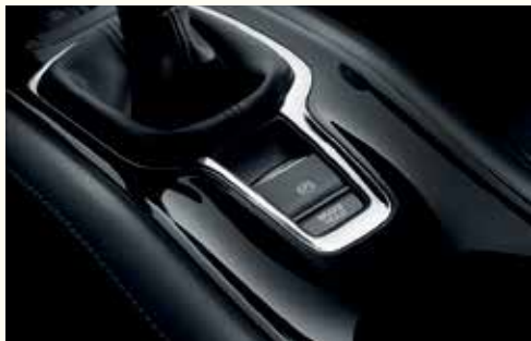
Електромеханічне паркувальне гальмо з функцією автоматичного утримання