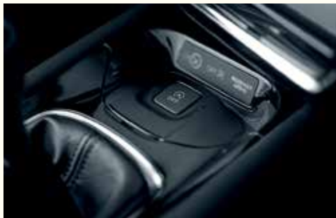
Система Айдл-Стоп (Idle Stop)