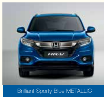
Brilliant Sporty Blue METALLIC

Зверніть увагу, що кольори на папері можуть дещо відрізнятися від того, як вони виглядають насправді